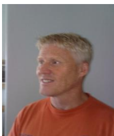
Herr- och pojkdelen